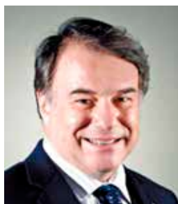
President, International Institute for Management Development (IMD)

2009 wurde er in den Vorstand des Verbands Schweizer Unternehmen, economiesuisse, gewählt und zum Vorsitzenden des Think Tank Avenir Suisse, Zürich, ernannt. Er ist Mitglied im Internationalen Komitee vom Roten Kreuz (IKRK) in Genf und hat ein Nachdiplom der Harvard Business School.