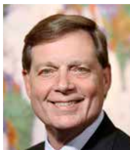
Robert E. Black

Er wurde von der Regierung von Pakistan als Distinguished National Professor ausgezeichnet und war Gründer des National Research Ethics Committee (2003–2014). Zulfiqar A. Bhutta ist Mitglied der vom Generalsekretär der Vereinten Nationen eingesetzten unabhängigen Expertengruppe (iERG) für die Überwachung des globalen Fortschritts beim Erreichen der Millenniumsentwicklungsziele für die Gesundheit von Mutter und Kind.